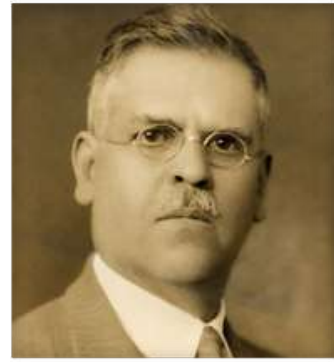
1873 - Mariano Azuela González

Fue una científica rumana, pionera en geriatría y gerontología. Descubrió que la procaína, un anestésico utilizado por los dentistas, contenía múltiples propiedades terapéuticas, como prevenir el envejecimiento.