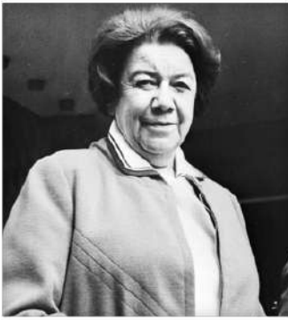
1897 - Ana Aslan