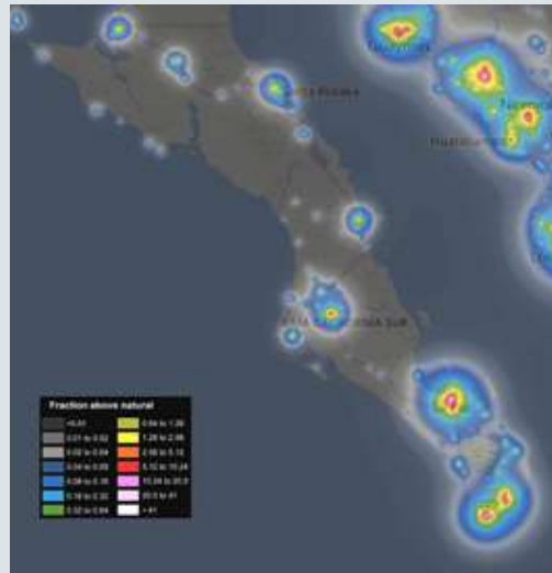
Figura 2. Mapa de registros. Proporcionada por el autor.