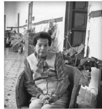
1926 - Armida de la Vara y Robles

Fue un poeta simbolista búlgaro. Considerado como uno de los mejores talentos poéticos del Fin de siècle del Reino de Bulgaria. Su vida y obra están estrechamente relacionadas con la Organización Interna Revolucionaria de Macedonia.