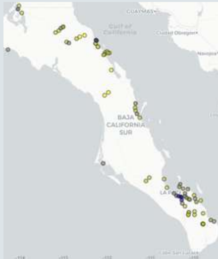
Figura 1. Los resplandores en el estado.

El proyecto continuará con el estudio del cielo sudcaliforniano, particularmente los mejores sitios, para su caracterización con mayor detalle. Es necesario que la población conozca acerca de este patrimonio para preservarlo como es debido y darle un uso adecuado. Adicionalmente, se podrán tener argumentos para que la reglamentación de desarrollo urbano contemple disminuir la contaminación lumínica, pero eso es tema para otra ocasión.