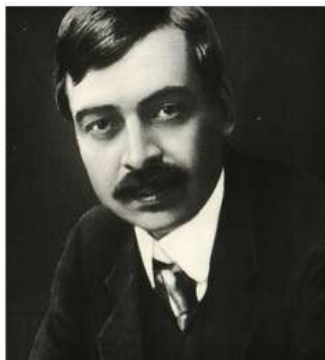
1878 - Peyo Yavorov

Fue un médico y escritor mexicano. Opositor al porfiriato, trabajó como médico en un campamento de Pancho Villa, experiencia que reflejó en su novela más popular, Los de abajo, y en otros de sus trabajos. Está considerado uno de los fundadores de la literatura de la Revolución Mexicana.